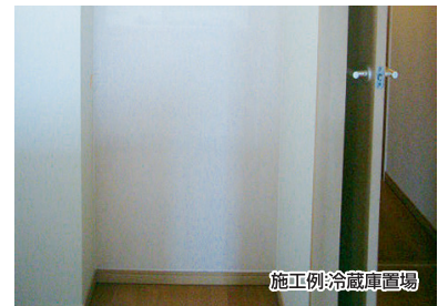
施工例:冷蔵庫置場