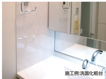
施工例:洗面化粧台