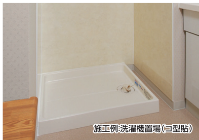
施工例:洗濯機置場(コ型貼)

お掃除したくても手が届かない…。お掃除してもすぐに汚れてしまう…。なにかと煩わしい場所にカベガード。カベを傷めず、お手入れ簡単、清潔空間を保ちます。